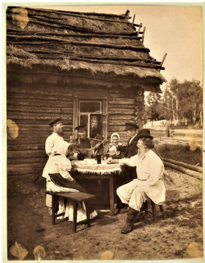
Группа крестьян за обедом