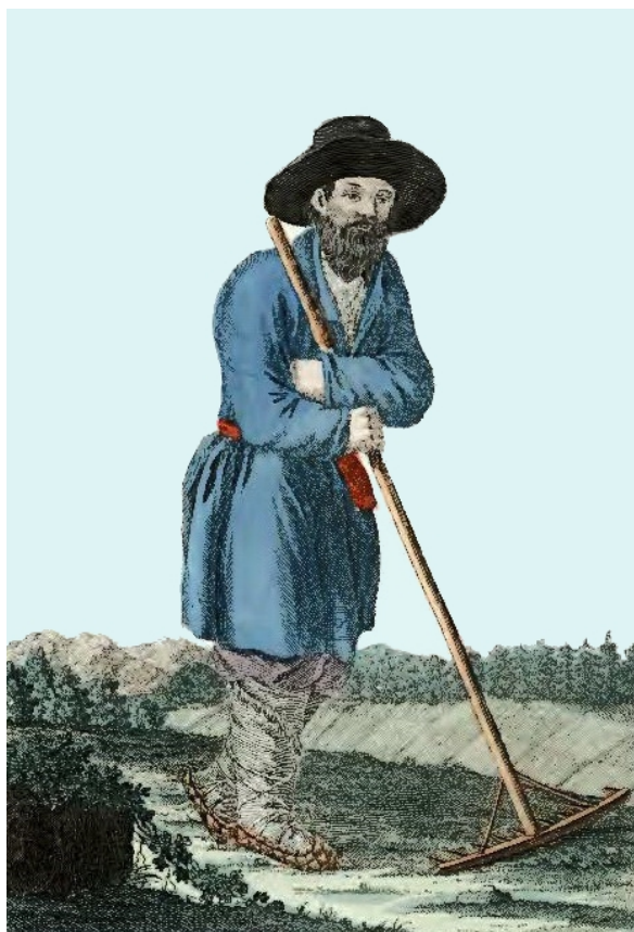
И.Г. Георги. Российский крестьянин, 1799 г.