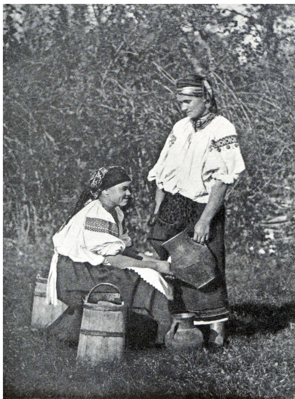
Поясная женская одежда, XIX в.

передником. В праздники исподница из шерстяной же узорчатой ткани, называемой мухояром, заменяет поневу. Выходя на работу, или куда бы ни было из дому, надевают коротенькую, суконную кофту, называемую свиткою или юбкою, под которую зимою бывает такая же шубка.