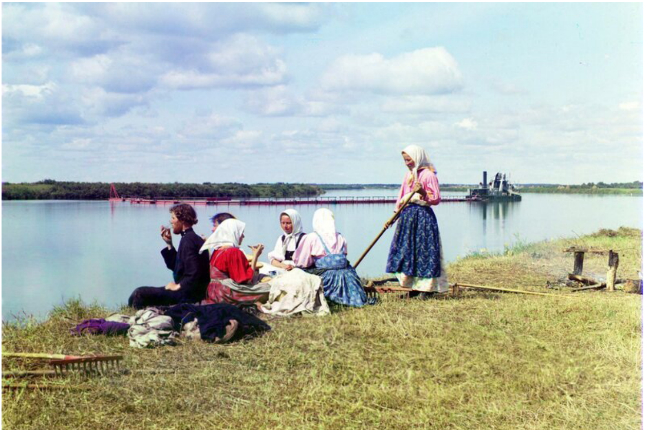
С.М. Прокудин-Горский. Обед на покосе, 1909