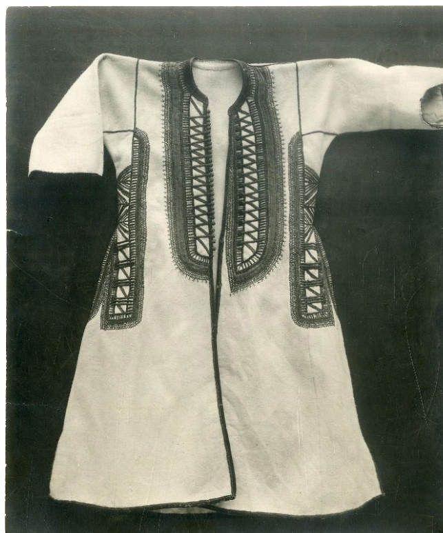
Женский кафтан из светлой ткани, Этнографический музей, 1867