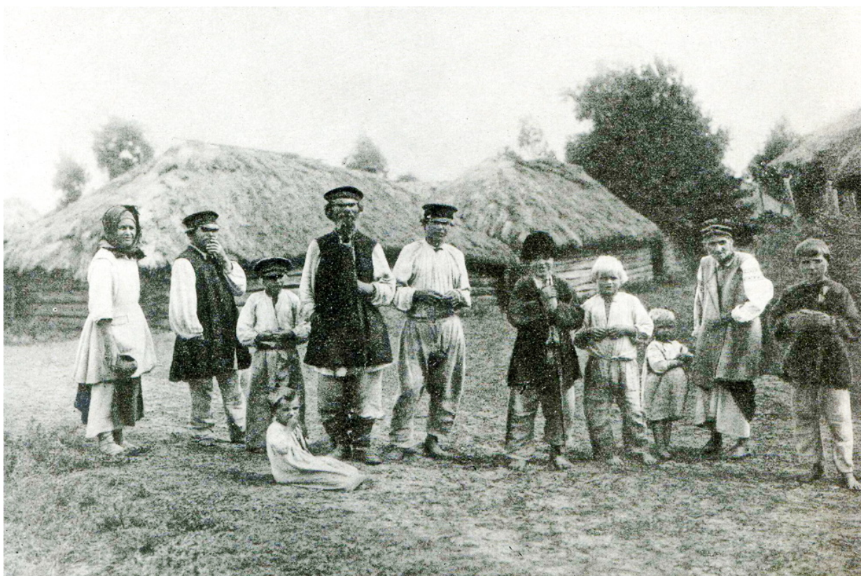
Типы летней крестьянской одежды. Черниговская губерния, с. Пакуль, 1903 г.

Одевались мужчины и женщины довольно опрятно и просто. Одежда праздничная – новая, а будняя – старая. У мужчин свита или кафтан – белые, серая