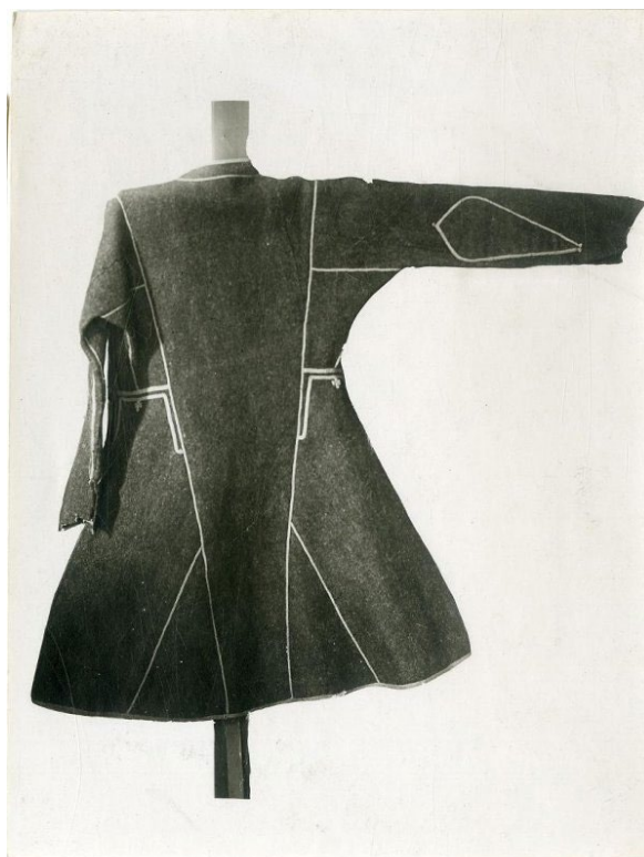
Кафтан со стоячим воротником, Этнографический музей, 1867