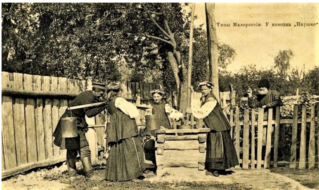
У колодца в Малороссии

«В замене прежних мушкованных сподниц нередко надевают уже саян из критону «бурдяного цвету». В мужской одежде, наоборот, овечье сукно осталось, как и было, но вместо прежней юбки появился настоящего фасона пиджак. Люди пожилые о нем такого мнения: «Правда пиджак аккуратный и меньше сукна идзе на його, но зато старую юбку як даносишь – на анучи нарвешь, а с пиджака анучи вузки будуць», – пишет Мария Косич».