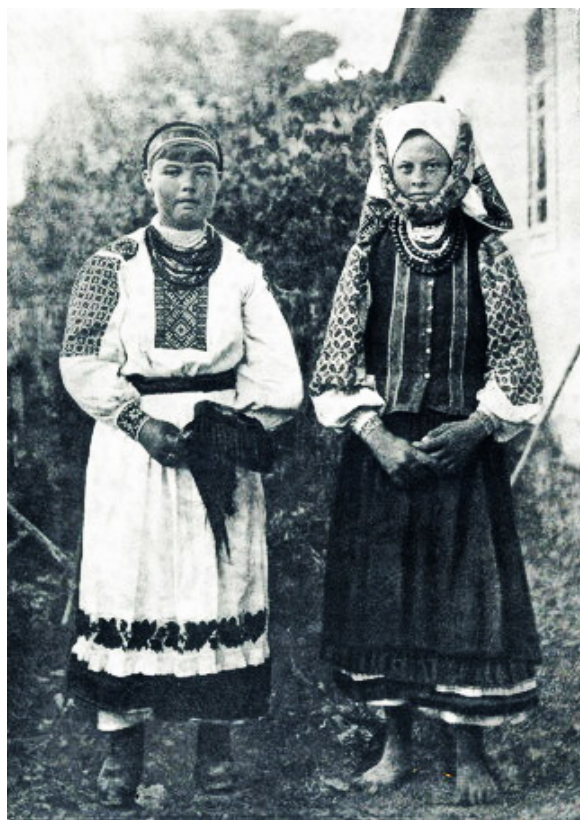
Летняя женская одежда, 1909 г.

Длинные свиты и шубы у женщин редко видны и составляют только часть приданого невесты, а в других случаях едва ли когда делаются. В обыкновенное время женщины повязывают голову белым холщовым платком, по чепцу (ватированной шапочке); в праздники платок бывает цветной, бумажный, и т. п. Национальный же головной убор составляет наметка, или кусок белой, тонкой ткани, узко сложенной. Она обвивается вокруг головы несколько раз и спереди составляет вид кокошника, а сзади оканчивается двумя висячими концами; но этот наряд употребляется более пожилыми, и кажется, выводится, а молодежь носит разноцветные платки».