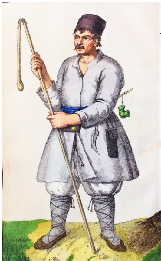
А.И. Ригельман. Малороссиянин-литвин, 1847 г.

Крестьяне края, образовав близ польских границ обширные села и будучи выходцами белорусского племени, слились с казачеством, приобрели оттенки, отличающие их от прочих малороссиян, и получили, как уже указывалось, народное название литвинов, то есть выходцев из Литовской Руси.