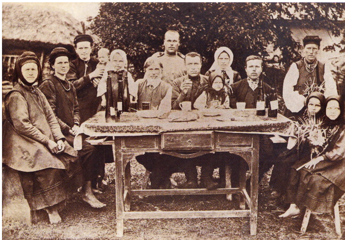
Праздничный семейный обед в Малороссии, 1916 г.