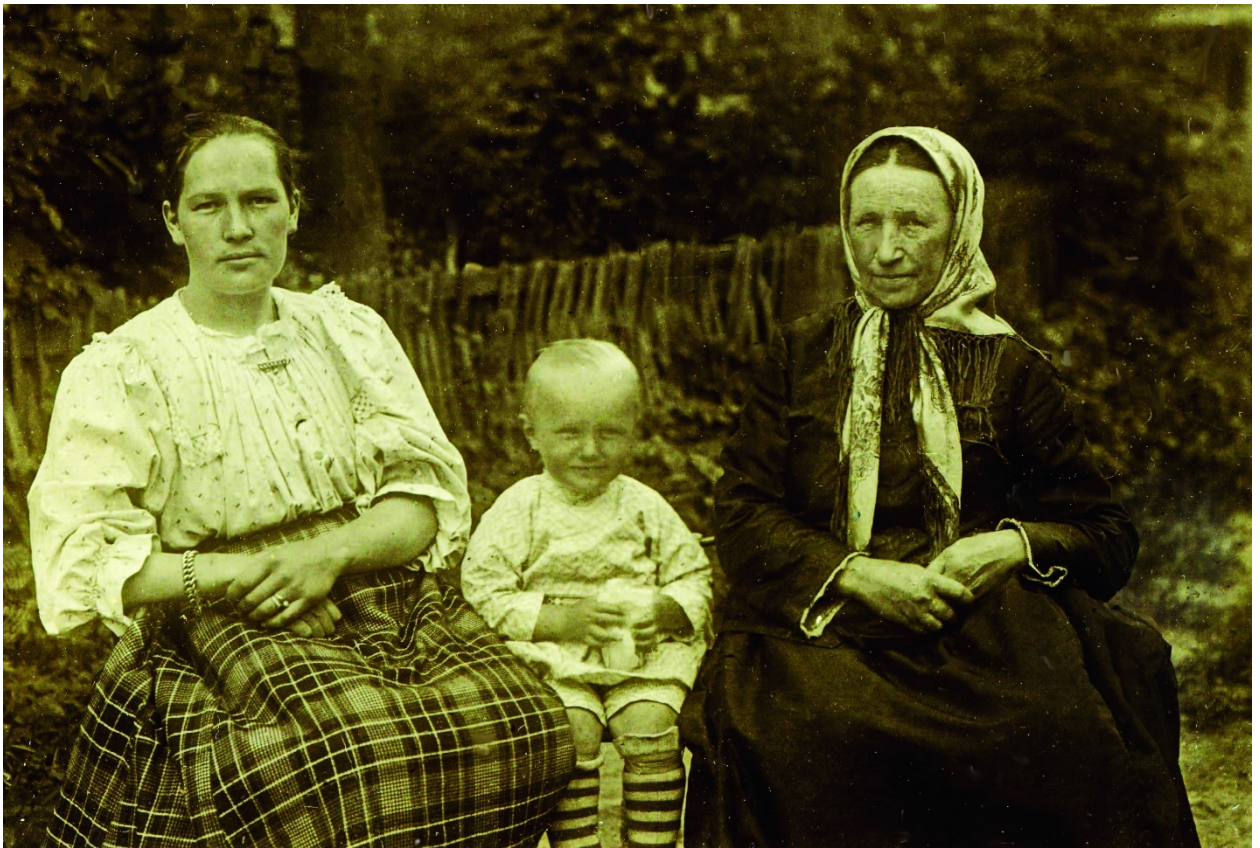
Семья Парамоновых с. Нивное Мглинского уезда, 1898 г.

Обряды религиозные строго соблюдаются и вообще набожность и нравственность видны в некоторых отдельных селениях, где священники и владельцы поддерживают их собственным примером. Вообще простолюдины нрава тихого, миролюбивого и покорного; хитрость и притворство встречаются часто, примеры же буйства очень редки. Зато беспечность и нерадение проявляются довольно часто и чем беднее семейство, тем беспечнее. Кажется, нужда отнимает у человека всю энергию.