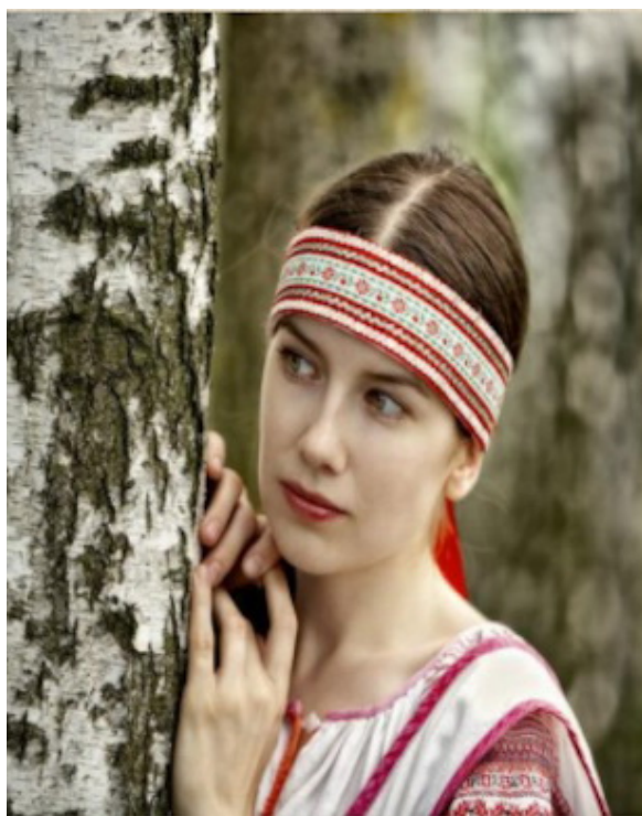
Лента на голове девушки

Незамужние девицы на голове носили платки и венцы. Замужние – кокошники и кички разнообразных видов. Эти сложные конструкции на берестяной основе изготавливали специальные мастера при церквях или ремесленных лавках.