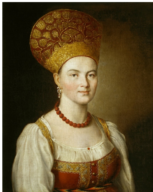
И.П. Аргунов. Портрет неизвестной крестьянки в русском костюме, 1784

Широко распространенным головным убором женщин была кокошник. Кокошник – это верхняя часть головного женского убора. В качестве нижнего головного убора выступал «волосник» (род шапочки, чепчика, называемого иногда «зборником»).