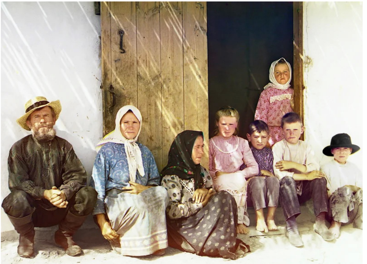
С.М. Прокудин-Горский. Семья поселенца, ок.1900