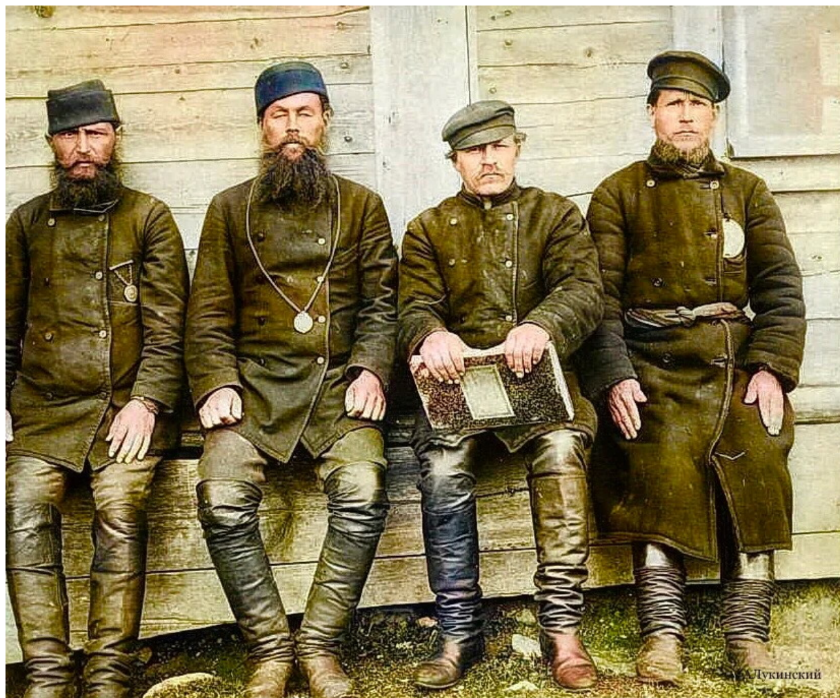
Волостное начальство. Слева направо – волостной старшина, староста, сборщик податей, сотский.

Отмена крепостного права разбила вековые старорусские крестьянские общины, где все решалось и распределялось поровну. Возникли волости и новое волостное начальство со своими атрибутами власти в виде нагрудных зачков и стилем одежды 11 .