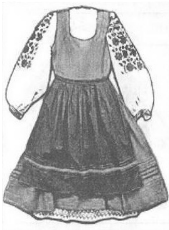
Женский костюм края, 40-е годы XX века

овчинки, сшитые с перехватом в талию и украшенные на спинных швах у пояса ярко красными шерстяными латками, вершка в два в форме червонаго туза. <...> Сверх белой рубахи с широкими рукавами надевается сарафан, по-местному – «саян» или «сподница».