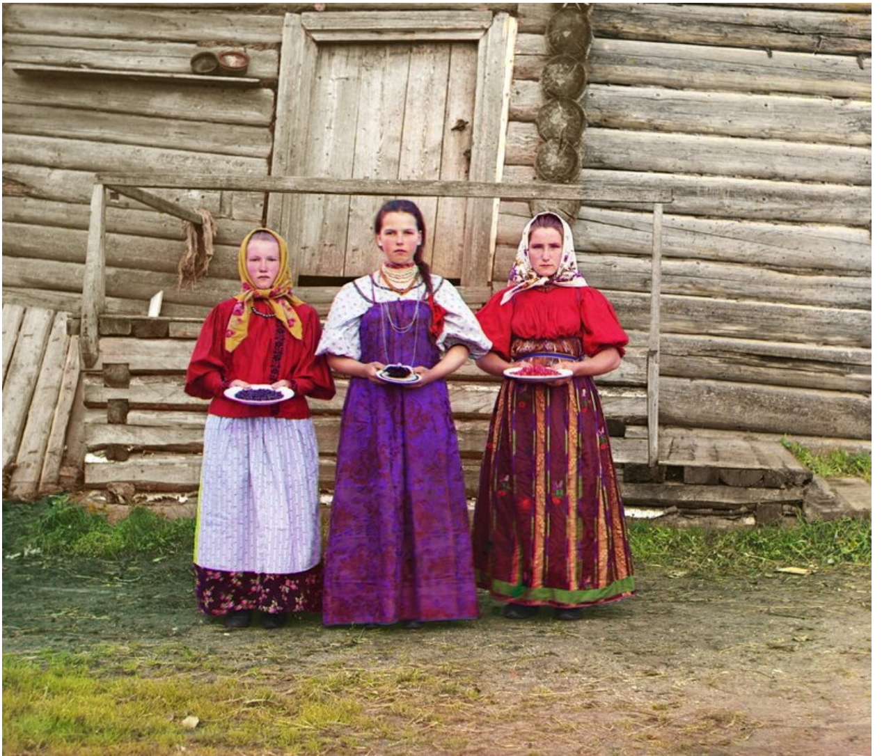
С.М. Прокудин-Горский. Крестьянские девушки с ягодами, 1905-1915